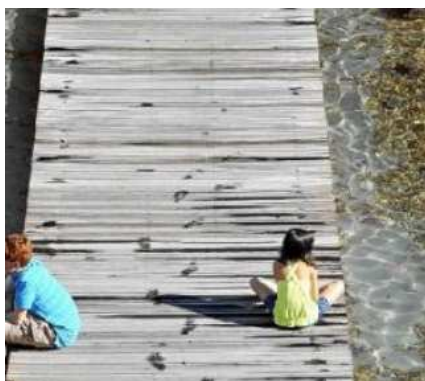
Una de las pasarelas de madera del Acuario, en el interior del recinto de Ranillas, en la que se ha utilizado madera de origen amazónico, del tipo "massaranduba". PEDRO ETURA